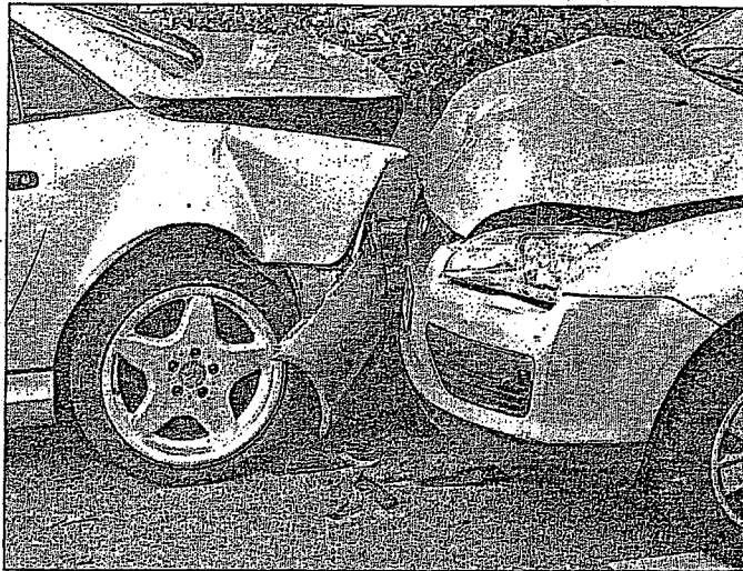
Die Höhe des Ersatzes soll nicht mehr vom Verschuldensgrad abhängig sein.

Jedermann ist berechtigt, vom Beschädigten den Ersatz des Schadens, welchen dieser ihm aus Verschulden zugefügt hat, zu fordern; der Schaden mag durch Übertretung einer Vertragspflicht oder ohne Beziehung auf einen Vertrag verursacht worden sein.