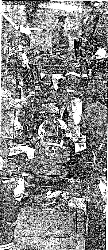
Deutschland verunglückt: Wer im Ausland verunglückt wird, muss außer den Schmerzen auch bürokratische Kalamitäten und gewisse rechtliche Unsicherheiten ertragen.

AUSLANDSUNFÄLLE. EU-Experten suchen in Wien nach geordneten Regeln für Klagen und Entschädigungen.